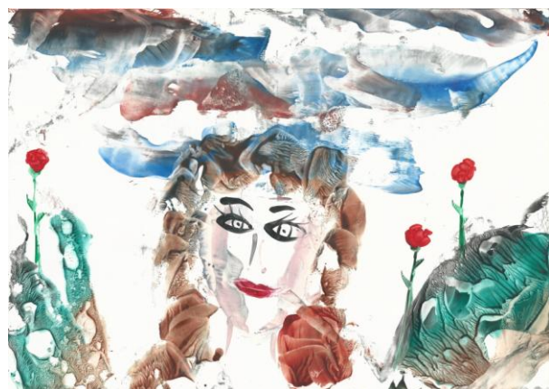
Peinture à la cire de Catherine Réault-Crosnier illustrant le poème « Le Faciès humain » de Maurice Rollinat, qui sera projetée le 8 mars 2025.